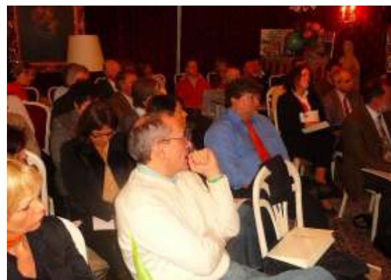
Der Vortrag und die Zuhörer