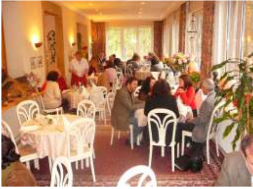
Das Mittagessen / Gastfreundschaft pur / fürstlich